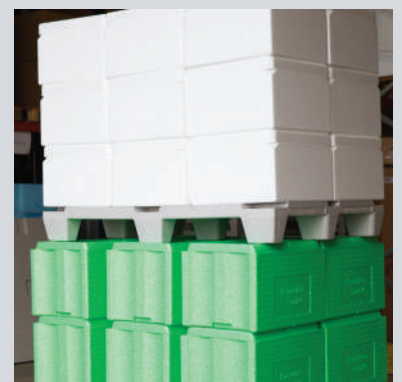
PALETTE INTERCALAIRE, UTILISÉE EN REGROUPEMENT